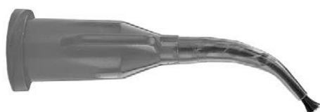
kanyla Inspiral Brush

Pokud používáte Composite Wetting Resin k zajištění klouzání nástroje, aplikujte malé množství na nástroj nebo povrch měkkého kompozita.